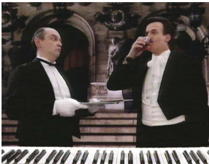
L'Orchestre de Zbigniew Rybczynski