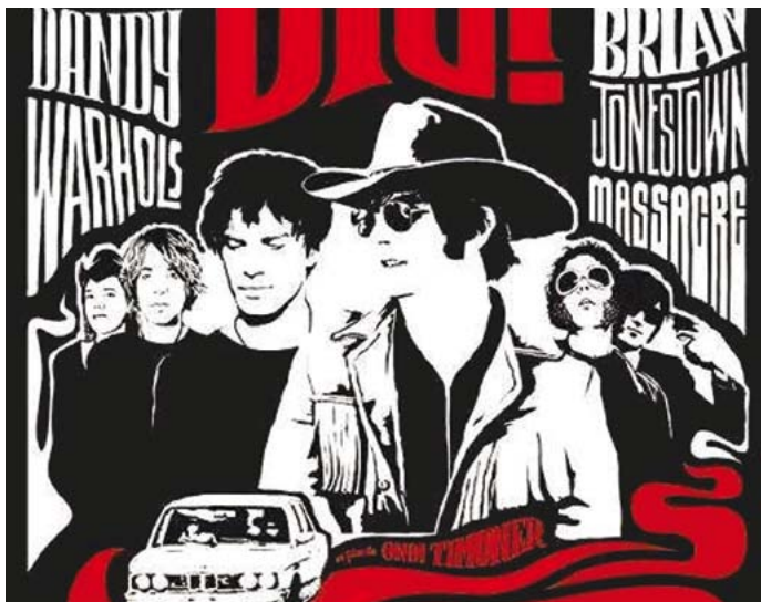
DIG ! de Ondi Timoner