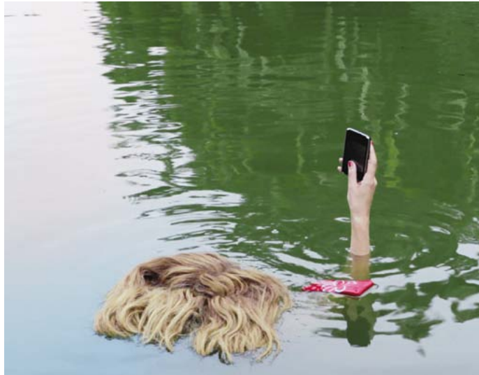
Matin de la Saint-Antoine de João Pedro Rodrigues