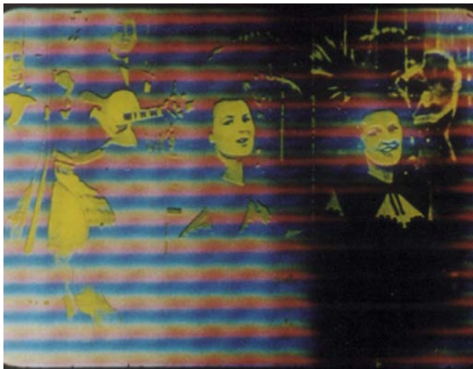
Synex and yours de Jeffrey Scher