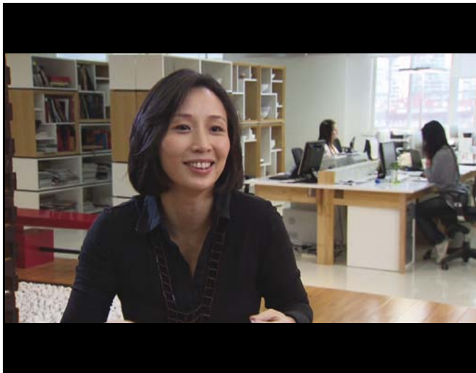
Jiang Qiong Er Créatrice de la maison de luxe Shang Xia